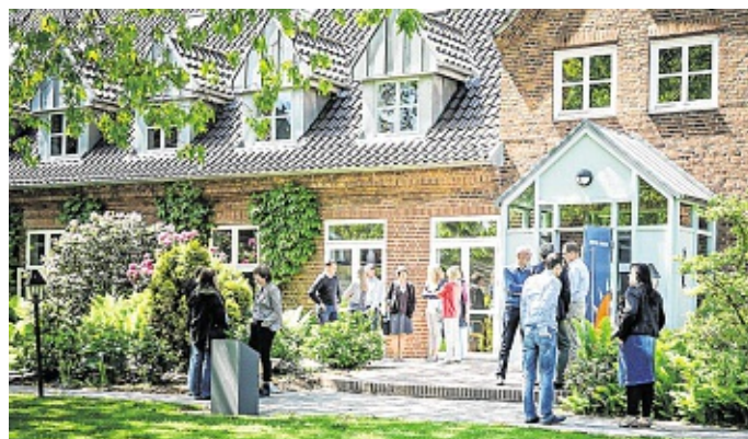
Weiterbildung und Information in angenehmer Atmosphäre ermöglicht der Deutsche Grenzverein in seinen drei Bildungsstätten.

Es folgten die Gleichschaltung ab 1933, die Neugründung nach dem Krieg mit dem Wirkungsgebiet Südschleswig und ab 1990 eine Konzentration auf die Arbeit in drei vereinseigenen Bildungsstätten, die ein breit gefächertes Angebot an Seminaren und Kursen mit politischem, kulturellem und kreativem Inhalt machen.